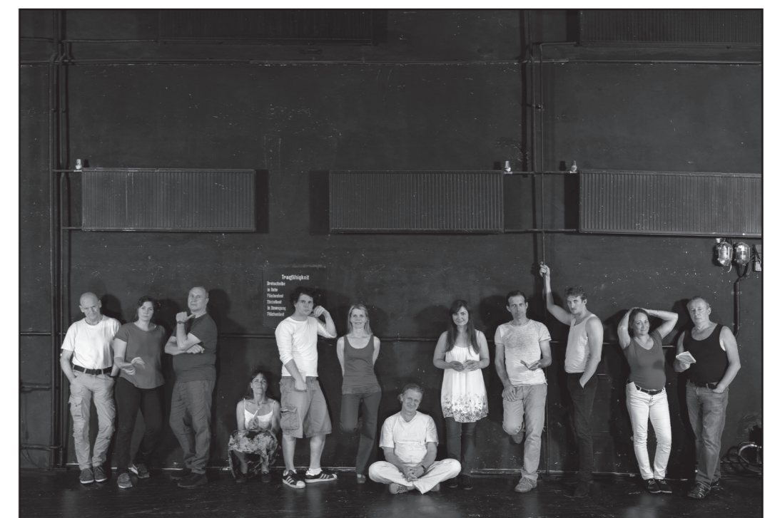
faust. vom eise befreit. ein spiel.