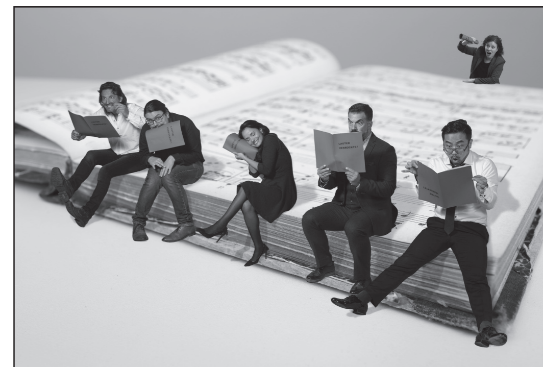
Lauter Verrückte! – Che Originali!